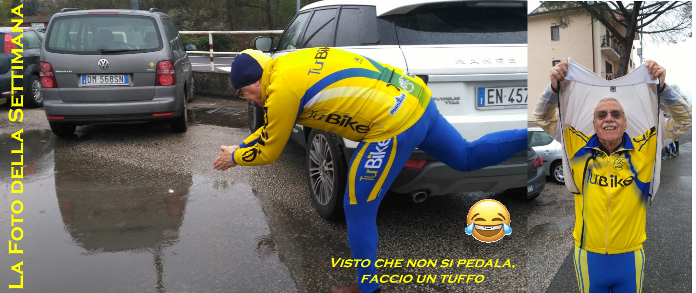
VISTO CHE NON SI PEDALA, FACCIO UN TUFFO